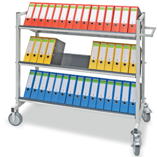
Ausführung mit 3 Ebenen