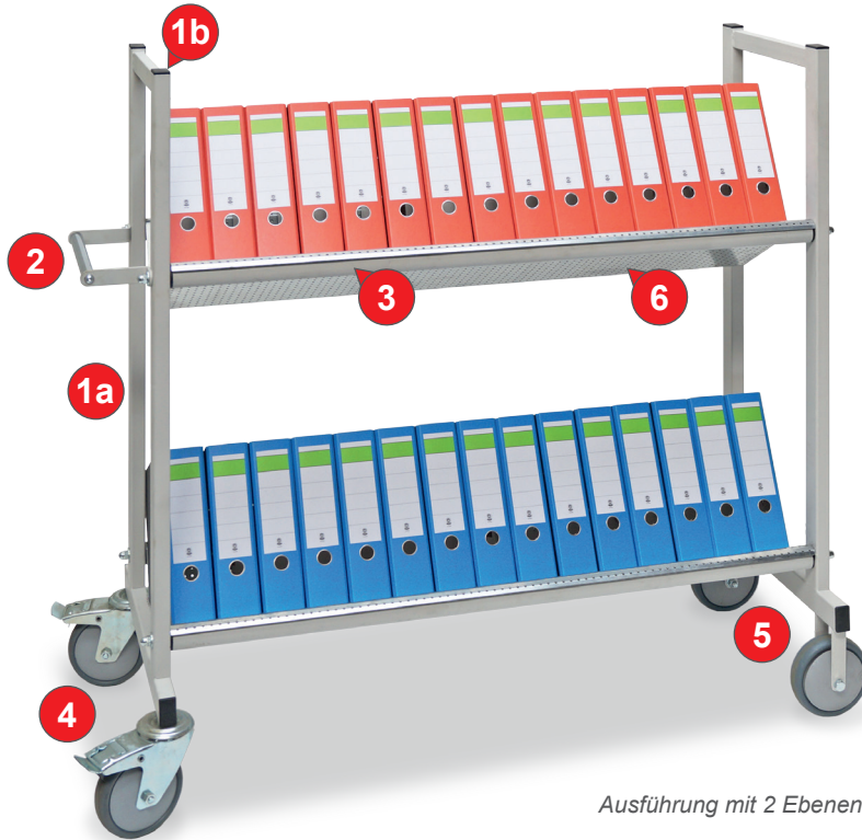
Ausführung mit 2 Ebenen